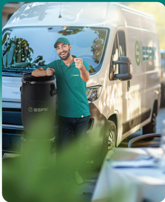
Vývoz kuchynského odpadu z gastro prevádzok